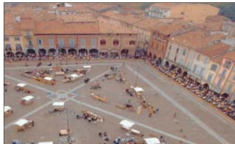
Lodi in Italien